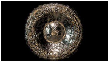
Maya Dunietz, 25hz-25fps , 2022, Video, Courtesy of the artist