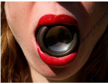
Maya Dunietz, Boom , 2024, Videostill

Auf der Homepage downloaden oder bestellen bei eveline.suter@kunstmuseumluzern.ch oder caroline.glock@kunstmuseumluzern.ch . Bitte melden Sie sich, wenn Sie Dateien von bestimmten Werken möchten.