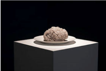
Maya Dunietz, Brain on a Plate , 2022, kinetische Skulptur, Silikon, Keramik, Motor, Programmierung